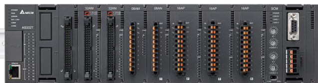
Compact Modular Mid-range PLC AS