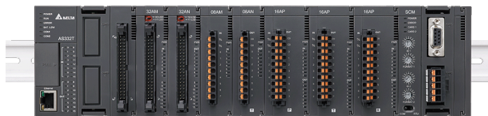
Compact Modular Mid-range PLC AS